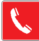
Telefono per interventi antincendio